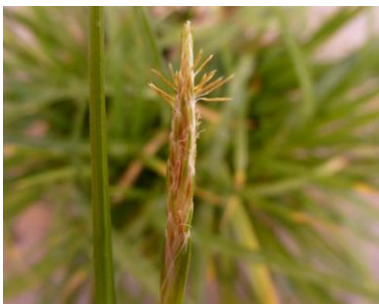
Am männlichen Blütenstand der Verarmten Segge ragen die Staubfäden heraus