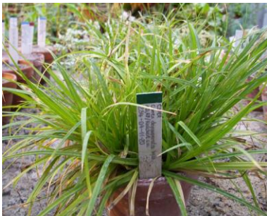
Verarmte Segge ( Carex depauperata ) in Erhaltungskultur des Botanischen Garten