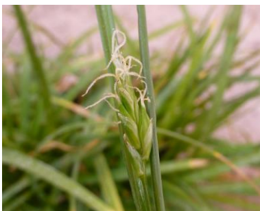
Am weiblichen Blütenstand der Verarmten Segge ragen die Griffeläste heraus