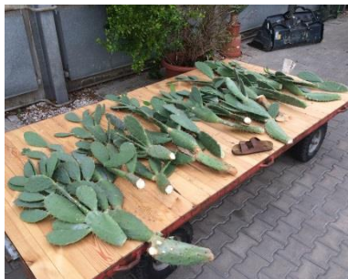
Die Opuntien, bevor sie zum Kunstwerk wurden