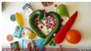
BigPicnic: Ein EU-Projekt zu Nahrungssicherheit