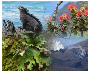
Vorträge, Workshops, Medienlese, Öffnungszeiten, Führungen und Pilzberatung im November