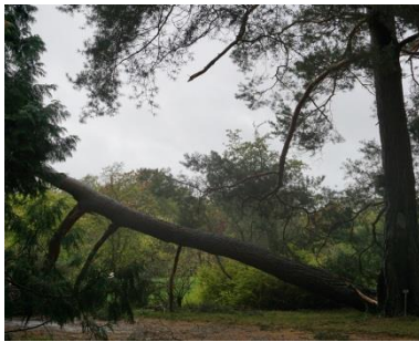
Stürme Xavier und Herwart wehten durch den Garten