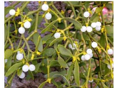
Vorschau Dezember: Christmas Garden Berlin geht weiter und weihnachtliche Führungen durch den Garten