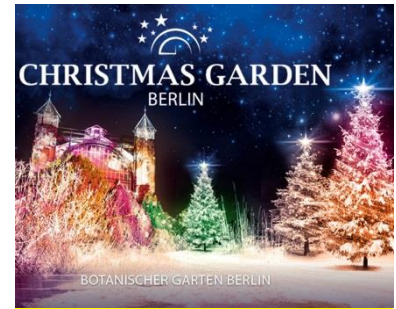
Christmas Garden Berlin: Winterspaziergang durch beleuchteten Garten und Eisbahn, 16. November 2017 bis 7. Januar 2018