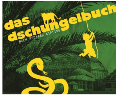
das dschungelbuch: Theater-Safari der Drehbühne Berlin durch die Tropenhäuser, bis 12. November 2017